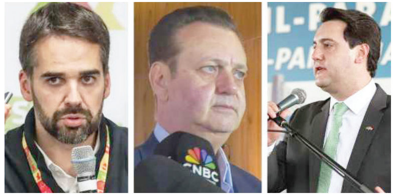
EDUARDO LEITE, GILBERTO KASSAB E RATINHO JR - AS OPÇÕES A TARCÍSIO

“Ele tem dito isso, que não vai sair presidente. E, da nossa parte, tem o nosso respeito, qualquer que seja sua decisão. Estaremos juntos seja na candidatura a governador, seja de presidente da República. Ele tem que fazer suas análises para saber quais são os rumos melhores para sua carreira