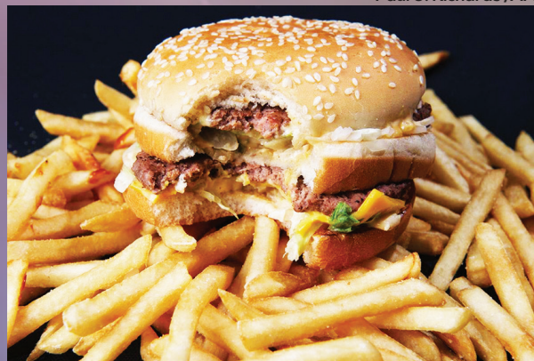
BIG MAC, TRADICIONAL LANCHE DA FRANQUIA MCDONALD'S

COMPARAR OS PREÇOS DOS BIG MACS É CONVENIENTE PORQUE O HAMBÚRGUER É ESSENCIALMENTE O MESMO EM QUASE TODOS OS PAÍSES. EXCEÇÕES NOTÁVEIS: ISRAEL É ÍNDIA,