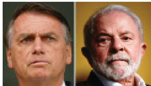
GRUPOS DA ESQUERDA OU CONSERVADORES TRADICIONAIS, FORMAM 46% DO ELEITORADO, MENOR QUE OS NÃO ALINHADOS

Os 54% que ninguém ouve podem não estar debatendo no X, mas sua moderação e anseio por união são o motor silencioso das eleições