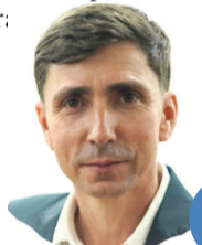
RENATO PADARIA (PODEMOS)

solicitou à Prefeitura a implantação de um restaurante de uso exclusivo dos servidores municipais, visando oferecer refeições com preços acessíveis aos funcionários - cobrando apenas uma taxa mensal de R$ 60 aos servidores.