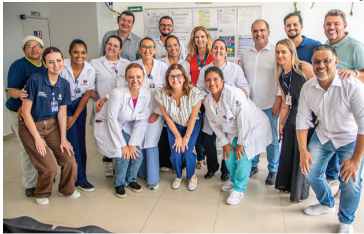
"O TRABALHO DA EQUIPE DE PONTA É FUNDAMENTAL" DISSE O SECRETÁRIO