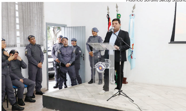
Cerimônia ocorreu na última quarta-feira (25/02), reconheceu policiais destaque do mês e homenageou 11 agentes com a Láurea de Mérito Policial