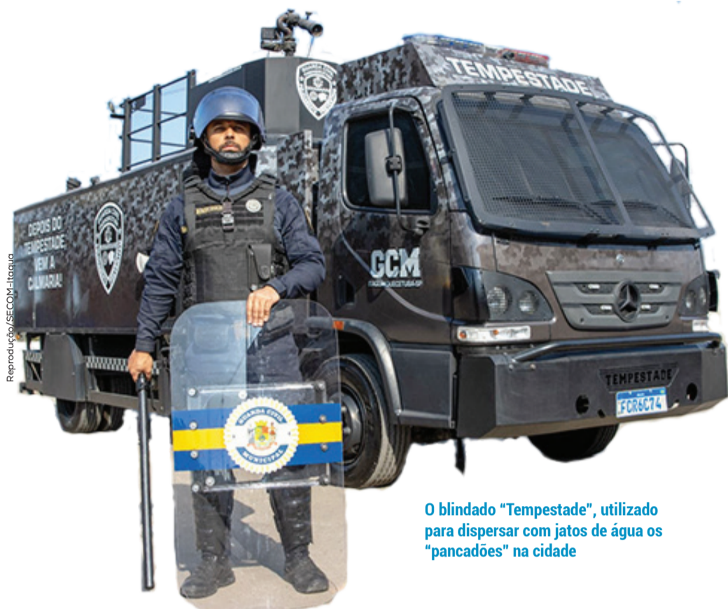
O blindado "Tempestade", utilizado para dispersar com jatos de água os "pancadões" na cidade