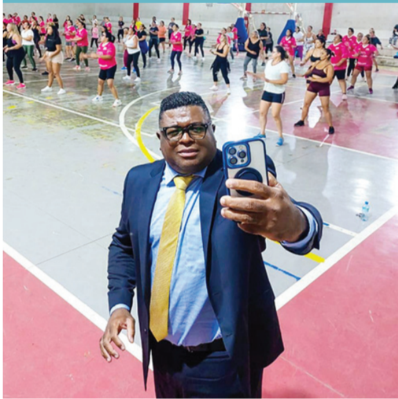
Assessoria/Ver. Fábio SURU