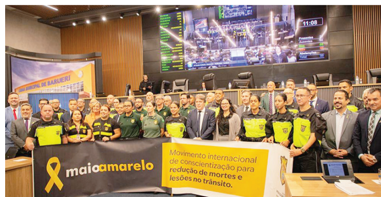
LANÇAMENTO DA CAMPANHA FOI NA CÂMARA MUNICIPAL

Os eventos ocorrerão até o dia 31/05. Para saber mais, entrar em contato com a Comunicação: (11) 4198-1878.