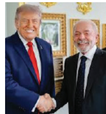
LULA NA CASA BRANCA, EM VISITA A DONALD TRUMP

A BlackRock abriu a chamada Brazilian Week, semana de eventos promovidos por bancos, empresas e organizações brasileiras em Nova York. A conferên-