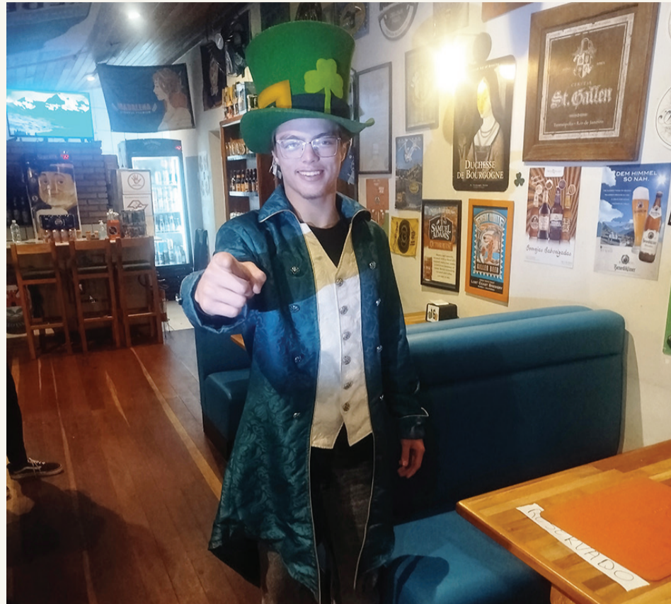
A CASA, QUE É ESPECIALISTA EM CERVEJAS, CELEBROU O SEU PRIMEIRO ANIVERSÁRIO COM MÚSICA POP, FOLK E GRANDE PÚBLICO. O PUB IRLANDÊS DE POÁ É ÓTIMO LUGAR PARA RECEBER AMIGOS

A casa também serve boa comida, com molhos feitos ali mesmo. A reportagem do Argu-