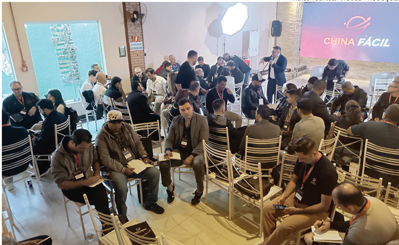
EMPREENDEDORES PARTICIPANDO DE EXERCÍCIO DE NETWORK, DURANTE A MENTORIA DE IMPORTAÇÃO, REALIZADA NA CIDADE DE POÁ-SP